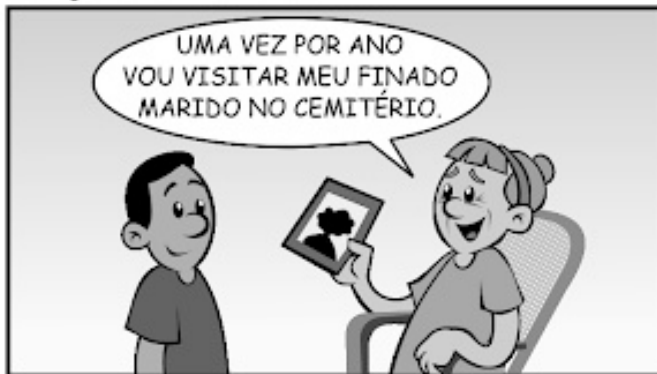
282 - VISITA DE FINADO