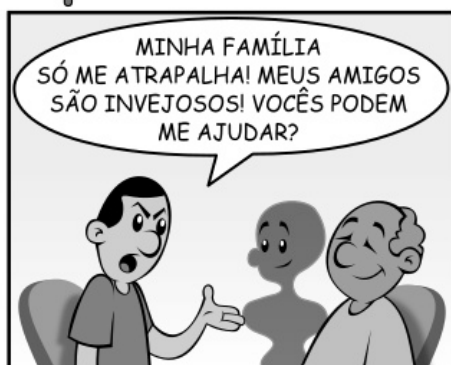
26 - PASSE