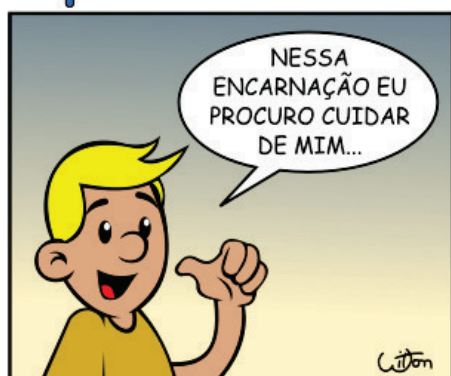
239 - EXERCÍCIOS